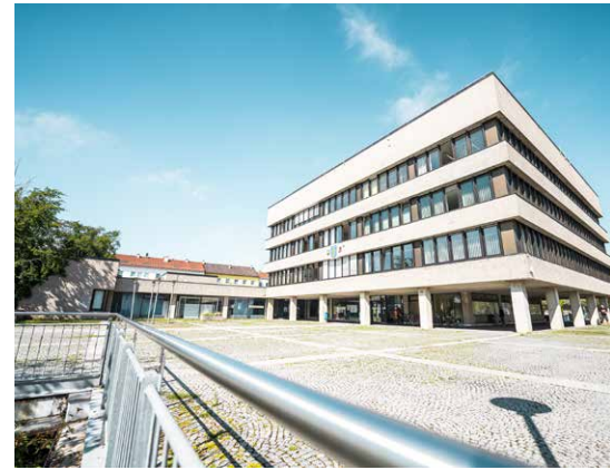
Auch am Rathaus wurde das Licht abgeschaltet

Auch jeder Waldkraiburger Bürger konnte mitmachen: In der vorgenannten Zeit wurde ein Zeichen gesetzt, indem alle Lichter in den Häusern oder Wohnungen eigenständig ausgeschaltet worden ist. Denn: Klimaschutz geht