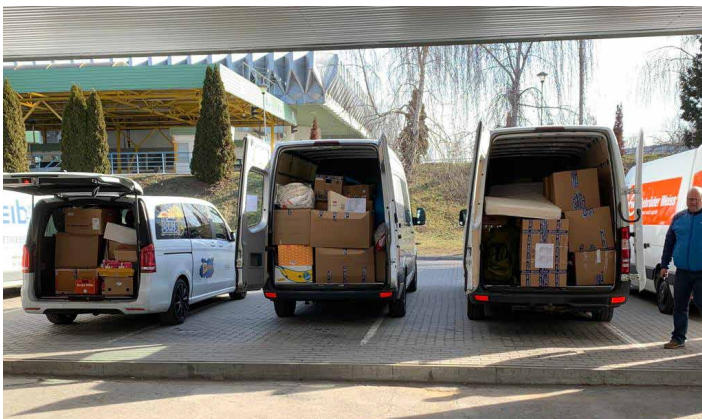
Der EHC machte sich selbst auf den Weg und fuhr sechs Transporter voller Hilfsgüter in die Ukraine.

Auch der EHC hat eine Spendenaktion initiiert. Am 11. März starteten sechs Transporter früh um 8 Uhr ihre Reise nach Ungarn, wo sie, 10km vom Grenzübergang entfernt, ihr Nachtlager bezogen, bevor es am nächsten Morgen in die Ukraine weiterging. Nach drei Stunden Wartezeit an der ukrainischen Zollkontrolle war die Kolonne dann endlich am Ziel angekommen: eine Tankstelle ca. 10km hinter dem Grenzübergang auf ukrainischer Seite. Die Hilfsbereitschaft war auch bei dieser Spendenaktion enorm. Die Annahme musste nach einiger Zeit gestoppt werden, da der Platz in den Transport-