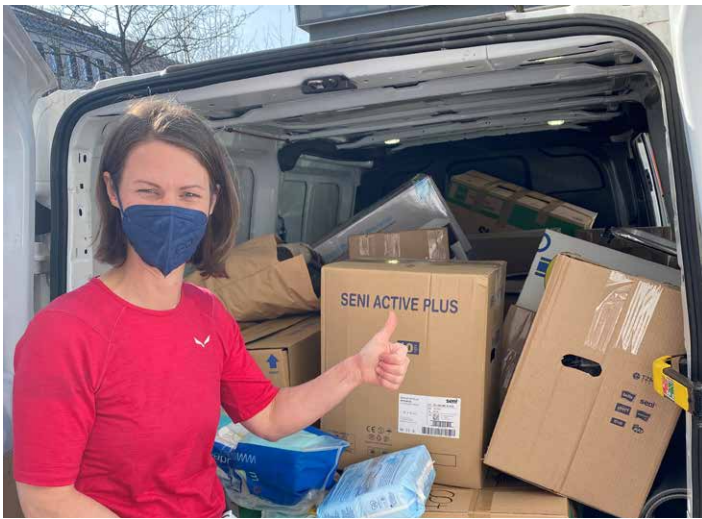
Die SZU konnte jede Menge Spendengut bei ihrer Spendenaktion sammeln

Die SZU, die eine Außenstelle in der Ukraine hat, hatte als eine der ersten in der Region zu einer Sachspendenaktion aufgerufen. Was zunächst nur für die Kollegen, sowie deren Freunde und Familien angedacht war, hat sich – auch dank der Unterstützung durch die Stadt Waldkraiburg – zu einer großen Spendenaktion entwickelt. Die Reso-