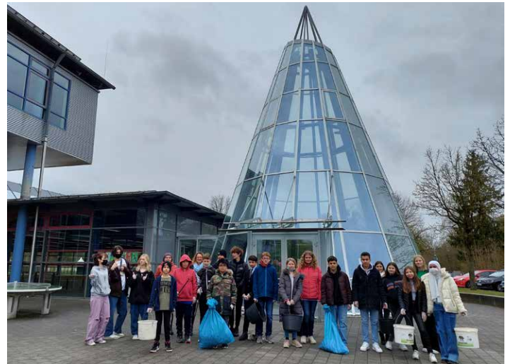
Auch das Gymnasium beteiligte sich beim großen Rama Dama.

„Es ist wichtig, immer wieder genauer hinzusehen! Ich hoffe, dass diese Aktion zum Nachdenken anregt und der Müll in Zukunft weniger wird“, sagte Erster Bürgermeister Robert Pötzsch. Teile, die in der Natur „entsorgt“ werden, werden im Laufe der Zeit langsam zersetzt, aber sie verschwinden nicht. Die Zersetzungsdauer kann enorm lang sein. Das größte Problem stellen die diversen Kunststoffe dar, die Gewässer, Landteile und sogar das Polareis belasten. Selbst weggeworfene Zigarettenkippen benötigen zur Zersetzung 10 bis 15 Jahre.