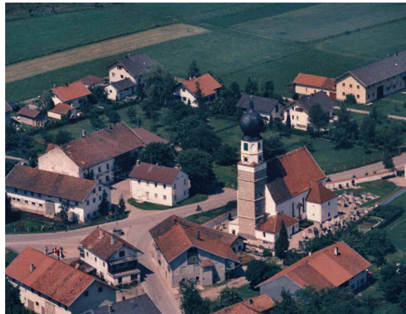
Luftbild von St. Erasmus, vorne Schmiede Pongratz und Filialkirche, dahinter das Gasthaus Hinterwimmer, Juli 1968.