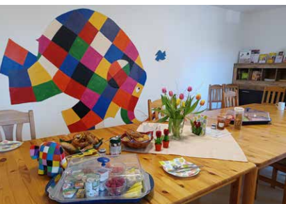
Elmar © David McKee

Anmeldung wird erbeten unter 0049 151 42059345 in deutscher und englischer Sprache. WhatsApp und email ot@familienzentrum-waldkraiburg.de auch in ukrainischer und russischer Sprache. Das Familienzentrum sucht Menschen, die dessen Angebot ehrenamtlich unterstützt und freut sich über jede praktische, ideelle und finanzielle Hilfe! Ganz besonders benötigt werden Menschen, die ukrainisch sprechen und verstehen.