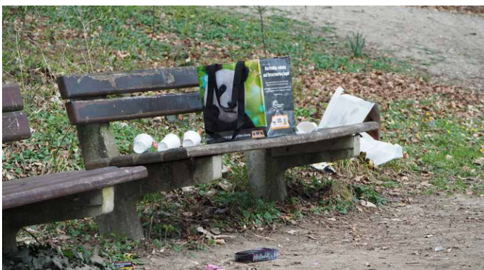
Leider auch in Waldkraiburg ein leidiges Thema: Verschmutzung an öffentlichen Plätzen, wie hier im Stadtpark.

Die Bandbreite der achtlos weggeworfenen Abfälle reicht von Zigarettenkippen über Take-Away-Artikel und (gefüllte) Hundekotbeutel am Wegesrand oder der liegen gelassenen Zeitung in den öffentlichen Verkehrsmitteln bis hin zu Glas-, Plastik- und Papierabfällen in Grünanlagen.