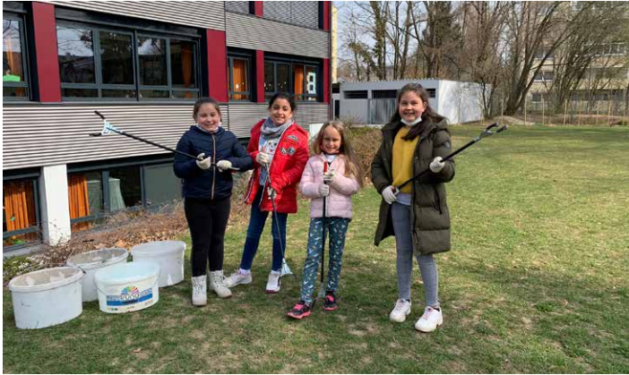
Die Schüler der Grundschule an der Graslitzerstraße machten bei der Aktion mit.

Trotz der Einschränkungen durch die anhaltende Corona-Pandemie konnten wir dieses Jahr unter dem Motto „Rama dama Light“ unsere Stadt säubern. Leider hat an unserem ursprünglichen Termin am 2. April das Wetter nicht mitgespielt. Dennoch gab es an diesem Tage einige fleißige Helfer die trotz der Witterungsbedingungen gesammelt haben. Am 9. April konnten wir einen Nachholtermin finden, an dem es auch das Wetter mit uns gut gemeint hat.