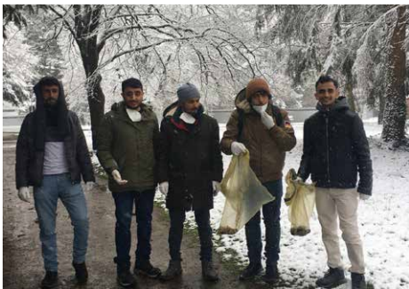
Einige fleißige Helfer haben dem Wetter am 2. April getrotzt.

Es erreichten uns sehr viele Anrufe engagierter Bürgern, die bei unserer Aktion mitgemacht haben. Es hat uns sehr gefreut, dass trotz der Auflagen so viele Personen beim Spazierengehen den Müll und Unrat aufgesammelt haben. Aus diesem Anlass, möchten wir uns bei allen, die an unserer Aktion teilgenommen haben, sowie bei unseren