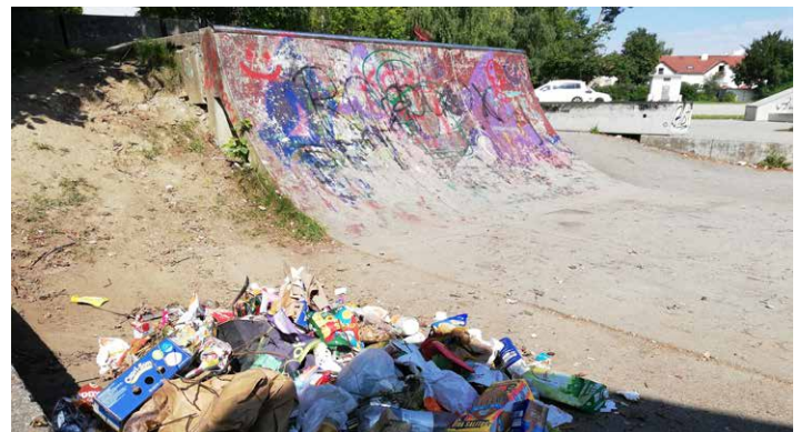
Auch am Skateplatz gib es häufig große Verschmutzungen.

Beim Spazierengehen Müll einsammeln? Dies bietet z.B. unsere Plogging-Gruppe in Waldkraiburg an.