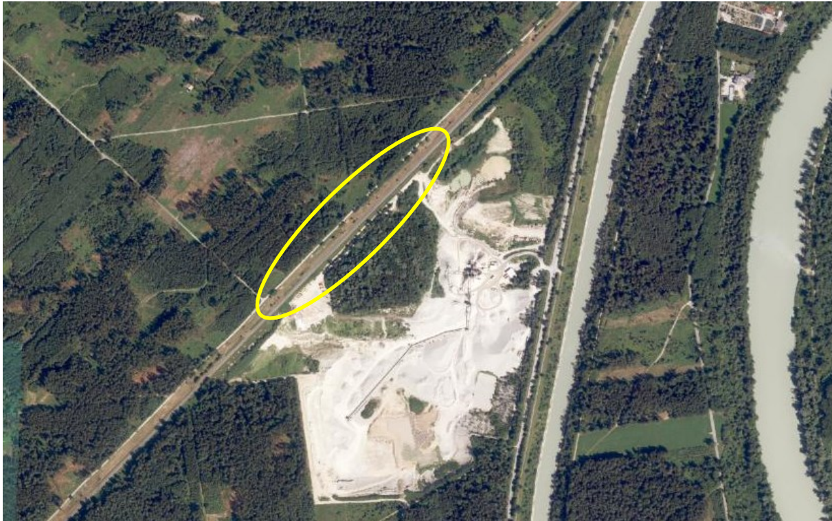
Abb. 2: Ort der Freilassung im Mühldorfer Hart